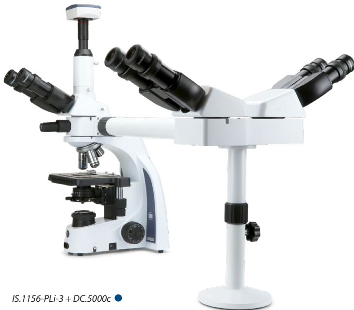
IS.1156-PLi-3 + DC.5000c ●